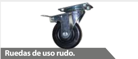
Ruedas de uso rudo.