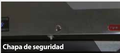
Chapa de seguridad