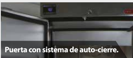
Puerta con sistema de auto-cierre.