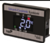
Control de temperatura inteligente remoto vía Bluetooth